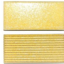
グレイスイエロー