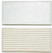
グレイスホワイト