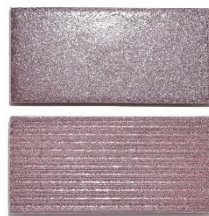
グレイスパープル