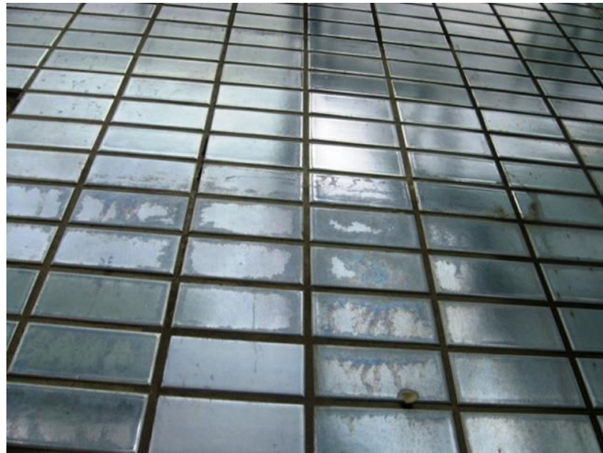
劣化したラスタータイル

従来、光り輝くタイルを製造するには釉薬を施釉し、焼成後その上からラスター釉を施釉するラスター加工が必要でした。ラスター加工を施したタイルは時間の経過などの影響により劣化していき黒い地肌が見えてしまうなど、普通のタイルよりもメンテナンスが大変なこともあり、導入するのにハードルの高い商品でした。しかし、長い研究の末ついにラスター加工を施さず、ラスタータイルより光り輝き、劣化しにくい Brilliant Vow シリーズの開発に成功しました。