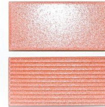
グレイスオレンジ