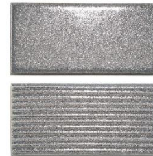
グレイスシルバー