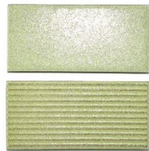
グレイスグリーン